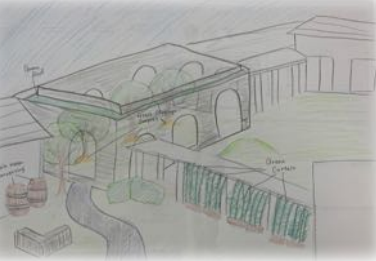
今のHiGAは水やエネルギーを無駄遣いしている。もっとサステイナブルにしたい。