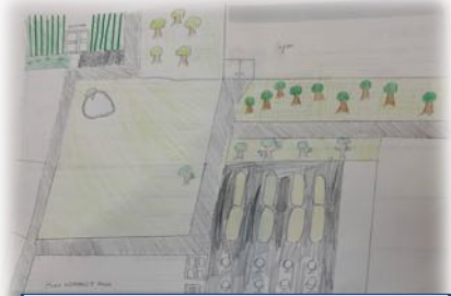
自然に優しい学校にしたい。