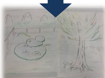
自然を最大限生かして住みやすく美しい学校にしたい。