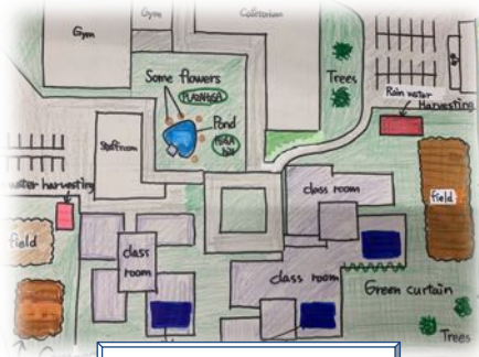
学校に畑を作りたい。