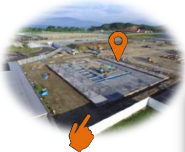
体育館/武道場建設中