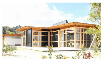
R3年度 進路指導部の取組