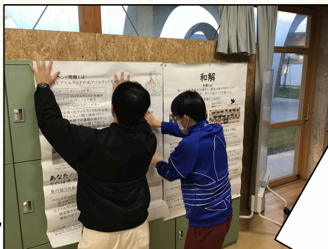
〔生徒会執行部の様子〕

今月は MVV月間 として、生徒会執行部が中心となって、平和リーダー、ラーニングコミュニティの観点から、HiGAのMission・Vision・Valuesに対する理解を深め、生徒一人一人が行動できるようにアプローチしてくれています！私たちは、リーダーになるためにできることを考えたり、身近で見つけたMVVに関連する場面や出来事をクラスで共有したりして、HiGAで学ぶラーニングコミュニティの一員として日々取り組んでいます！